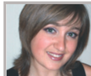
Juillet-Août 2007 Autonomie et polyvalence