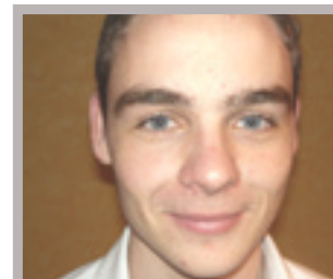
Septembre 2007 Evolution et formation